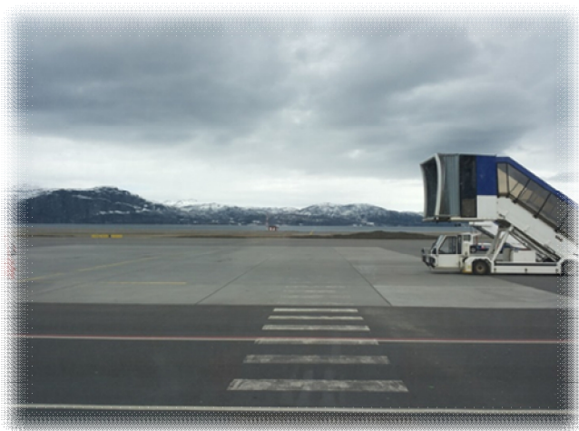
Вид из зала ожидания аэропорта г. Альта. Майское фото, зимних нет

Дорожка была не маленькой. Первоначальный маршрут: Сыктывкар – Москва – Стокгольм – Осло – Альта . Однако рейс в Москву был задержан аж на 7 часов из-за плохих метеоусловий, пришлось в экстренном порядке перебронировать билеты от Москвы до Альты, что вышло успешно и даже попроще: на следующий день с одной пересадкой в Осло. Летели авиакомпанией SAS (Scandinavian Airlines) , очень хороший сервис. По крайней мере, мне понравился. Билеты заказаны были на официальном сайте компании.